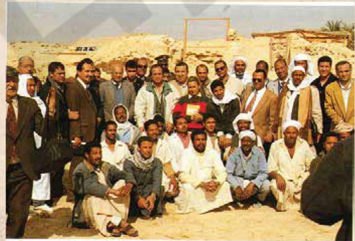
Αναμνηστική φωτογραφία από την παγκόσμια ανακοίνωση. Στό μέσον όρθιος παρίσταται ο Γενικός Γραμματέας του Όργανισμοῦ Αιγυπτιακῶν Ἀρχαιοτήτων Καθηγητῆς κ. Ἄμπντ' Ἐλ Χαλίμ Νούρ' Ἐλ Ντίν