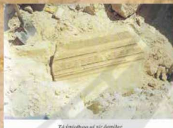
Τό επιτόβιο με τις ασπίδες