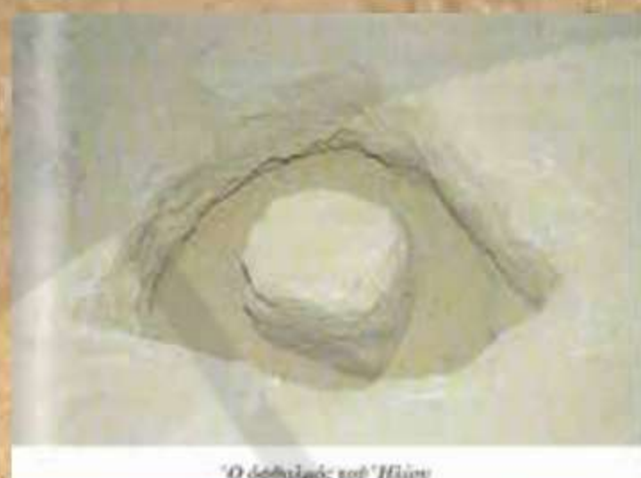
Ο οφθαλμός του Ήλιου