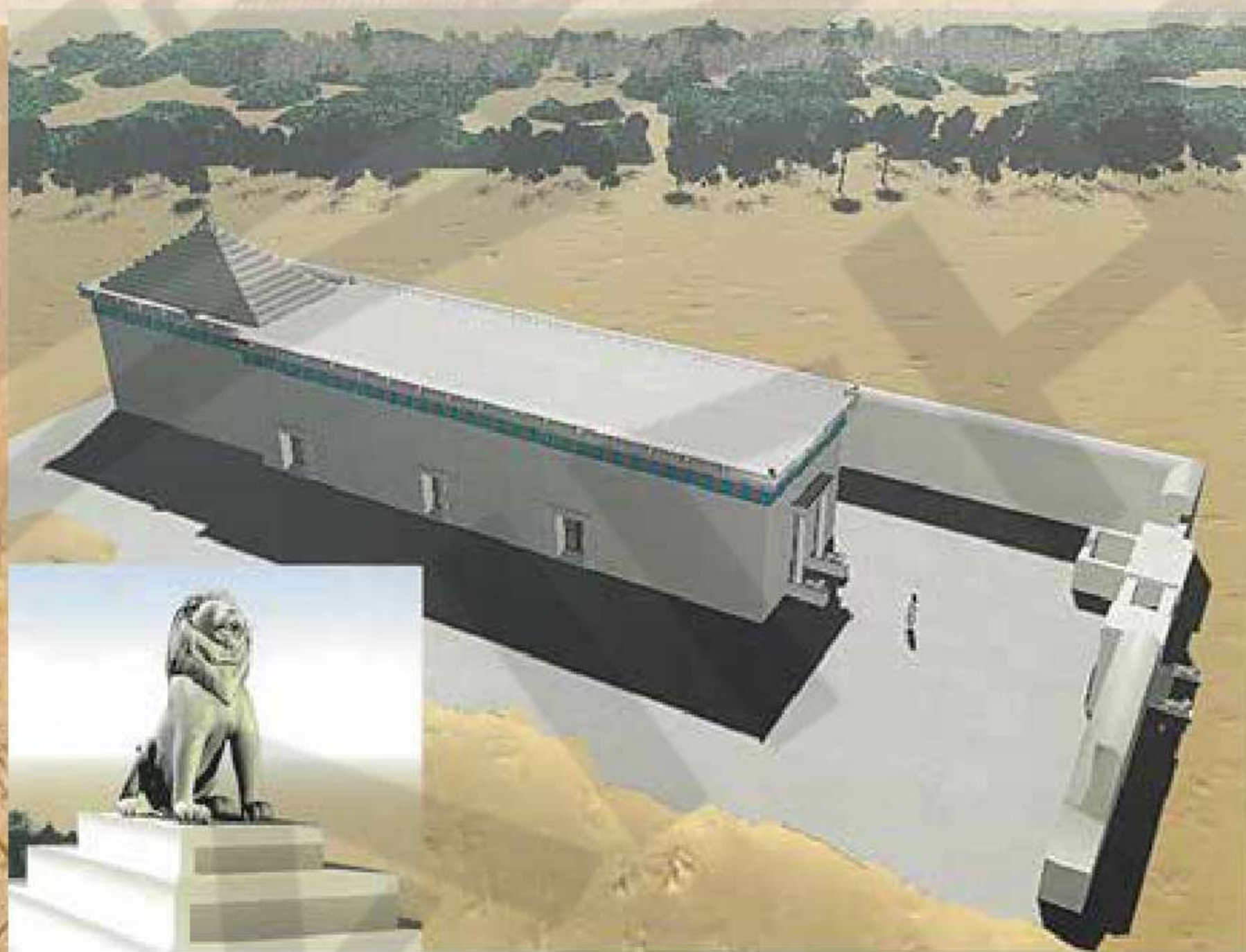
Εικονική πραγματικότητα του Τάφου με την επίσκεψη του Λέοντος

.....Μόνο σαν μακρινή ηχώ φτάνουν στα αυτιά μου κάποιες λέξεις ή φράσεις του Γενικού Γραμματέα Αρχαιοτήτων της Αιγύπτου που έσβηναν μπροστά στον χείμαρρο της συγκινήσεως μου. Έλεγε η φωνή του: «Πρόκειται για μία μεγάλη ανακάλυψη ... Τα κείμενα των επιγραφών δεν αφήνουν και το υπόλοιπο ίδιο .»